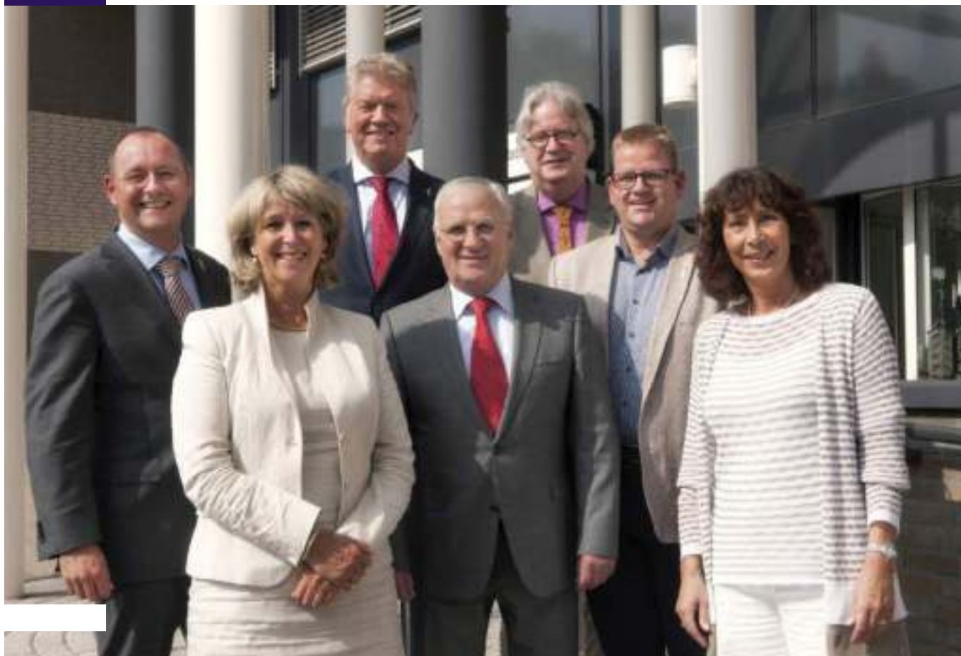
Het college van burgemeester en wethouders van Bergen op Zoom